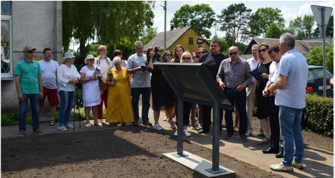
Buvusioje žydų sinagogos vietoje, prie Krakių seniūnijos pastato, įrengtas informacinis stendas apie Krakėse gyvenusių žydų bendruomenę.

NAUJIENOS / Bendruomenės / Krakėse duoklė atiduota žydų atminimui ir kultūriniam paveldui