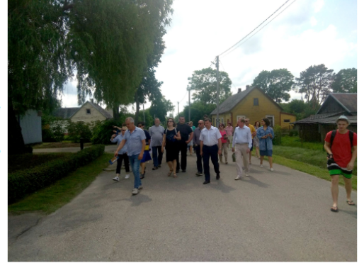
Krakėse vyko ekskursija po miestelį, kurios metu buvo supažindinama su Krakėse gyvenusiais žydais.

Šiuo metu pagal projektą yra įdarbinta viena darbuotoja, o bendruomenės lėšomis įdarbinta dar viena darbuotoja. Reiks tikrai daug jėgų ir pastangų, nes reikės ne tik dirbti, bet ir uždirbti. Bet suremsime visi pečius ir viskas bus gerai“, – optimizmo nestokojo D. Dubinkienė.