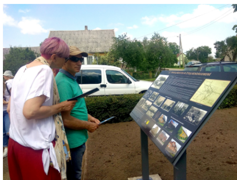
Buvusioje žydų sinagogos vietoje pristatytas naujasis informacinis stendas apie Krakių miestelio žydų bendruomenę.